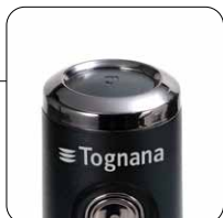
Blocco di sicurezza Safety lock