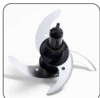
4 lame in acciaio inox 4 stainless steel blades