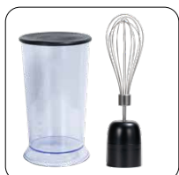
Sbattitore in acciaio inox e bicchiere da 700ml Stainless steel whisk and 700 ml jug with lid