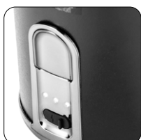
Indicatore livello di carica delle batterie Battery charge level indicator