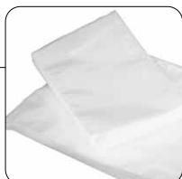
10 sacchetti 15x20cm inclusi 10 bags size 15x20 included

Rechargeable, cordless vacuum seal machine with 10 bags 15x20cm, external vacuum suction pipe with adapter for containers and bags fitted with valve, USB-C cable and charging adapter.