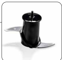
2 lame in acciaio inox 2 stainless steel blades

Rechargeable, cordless food processor, complete with USB-C cable, charging adapter, 2 slicing and grating discs.