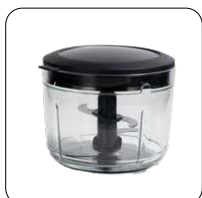
Contenitore in vetro con coperchio in ABS per conservare i cibi Glass container with ABS lid for storing food