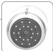
Base antiscivolo Non-slip base

Rechargeable, cordless chopper complete with container lid, emulsifying whisk, USB-C cable and charging adapter.