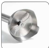
2 Lame in acciaio inox 2 stainless steel blades