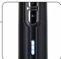
Indicatore livello di carica delle batterie Battery charge level indicator