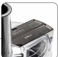
2 velocità di funzionamento 2 operating speeds