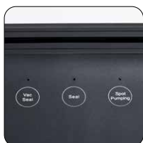
3 funzioni: sigilla, sottovuoto, vuoto esterno 3 functions: seal, vacuum, external vacuum