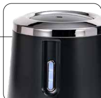
Indicatore livello di carica delle batterie Battery charge level indicator