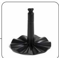
Disco ondulato per emulsionare Ripple disc blade to emulsify