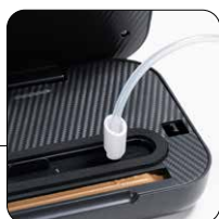
Tubo per vuoto esterno completo di adattatore External vacuum suction pipe with adapter