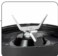
4 lame in acciaio inox perfette per gli smoothies 4 stainless steel blades perfect for smoothies

Rechargeable, cordless blender with 600ml plastic jug, USB-C cable and charging adapter.