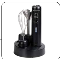
Base porta-accessori Space saver accessory support base