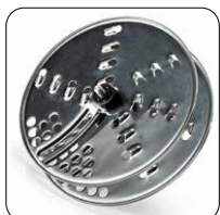
Accessori per affettare e tagliare le verdure a julienne, grattugiare Accessories for slicing and julienne cutting vegetables, grater