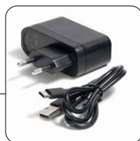
Cavo di ricarica USB-C e adattatore di ricarica USB-C cable and charging adapter