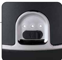
Indicatore livello di carica delle batterie Battery charge level indicator